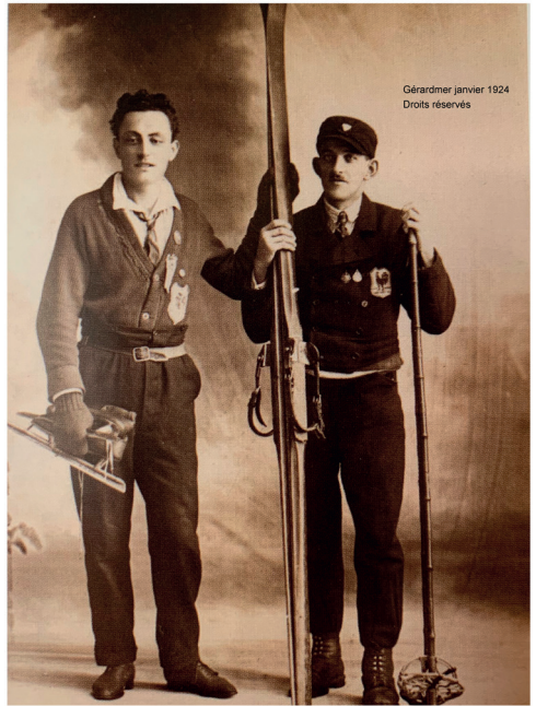
Gérardmer janvier 1924

24 photos grand format seront exposées près du lac de Gérardmer, entre le centre aquatique et les tennis couverts du 6 janvier au 8 septembre 2024. L'occasion de découvrir ces deux sportifs alors âgés de 19 ans qui ont participé aux premiers Jeux Olympiques d'hiver de l'histoire : le patineur André Gegout, alias « le grand Firasse », et le fondeur André Médy.